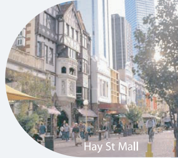
Hay St Mall