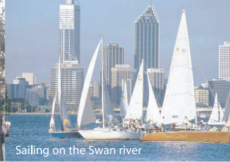
Sailing on the Swan river