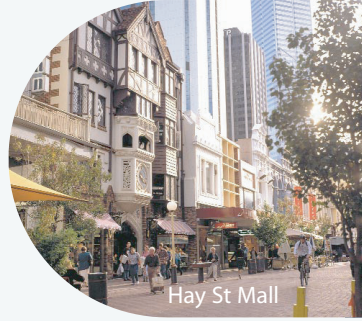
Hay St Mall